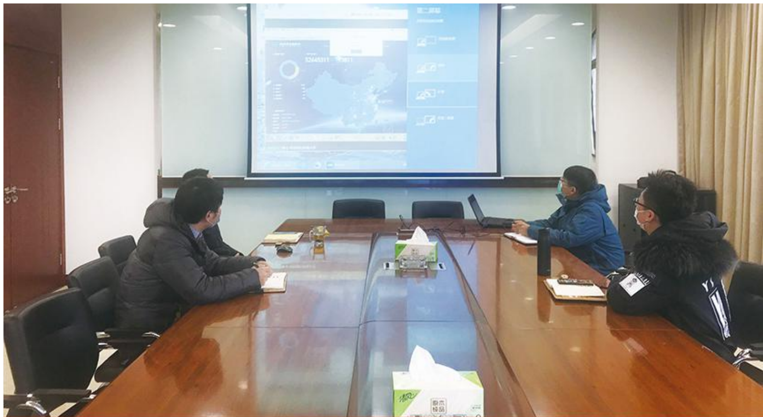
图为《金融集团科贷公司探索线上服务新模式》

惠措施。“这些帮扶措施主要针对所有参加防疫人员的家属，包括社区工作人员、医生等重点群体创业家属。”