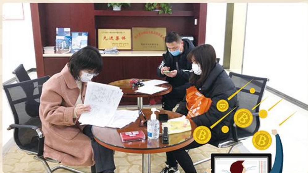
图为《新政“护航”企业复工复产》

疫情当下，金投科贷公司作为金融集团旗下国有控股子公司，展现出一个国有企业在此特殊时期的责任和担当。